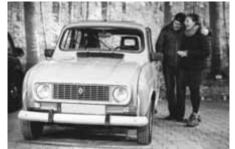
Der Renault 4

erhalten an der Kasse den ermäßigten Eintrittspreis.