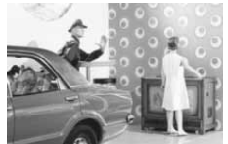
Knudsen Taunus mit Musikbox