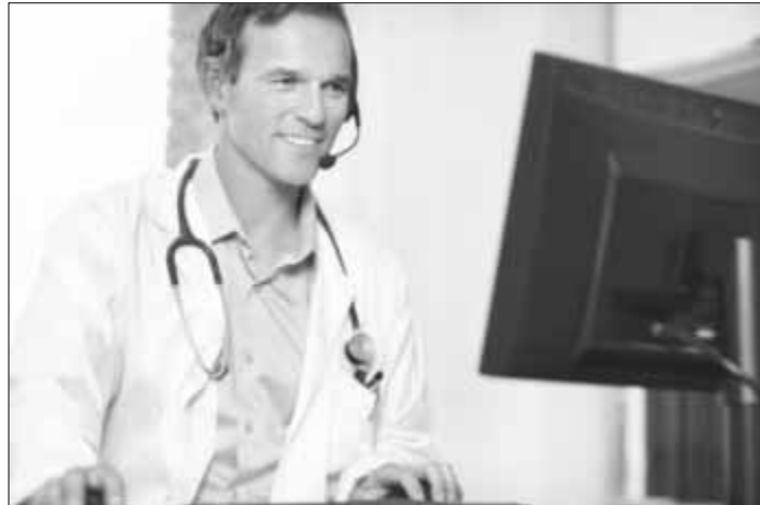
Sehen wir unseren Arzt demnächst fast nur noch über den Laptop?

Kontakt: Bad Wurzach Info, Rosengarten 1, 88140 Bad Wurzach/Allgäu, Tel. 07564/302-150, Fax: 07564/302-154, service@bad-wurzach-info.de, www.bad-wurzach.de, Kooperation: www.kraftquelleallgaeu.de