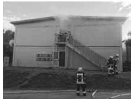
Feuerwehr-Übung bei den Flüchtlingscontainern