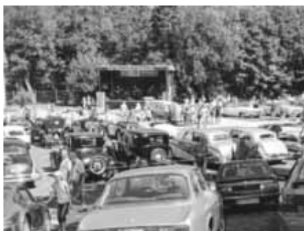
Oldtimer im Schlossgarten

Am 27. August 2017 findet die Veranstaltung „Talking Museum“ statt, bei der ganztägig die Eigentümer und Insider der Exponate mit interessanten Informationen zu den Fahrzeugen im Museum aufwarten. Interessierten Museumsbesuchern stehen während des gesamten Museumstages verschiedene Gesprächspartner für Benzingsprache oder zum Fachsimpeln bereit.