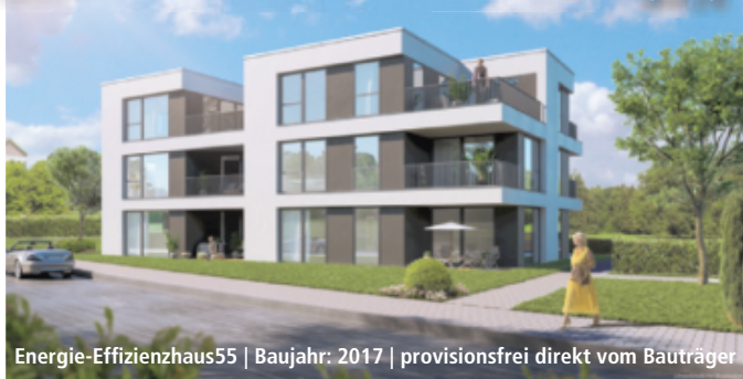
Energie-Effizienzhaus55 | Baujahr: 2017 | provisionsfrei direkt vom Bauträger