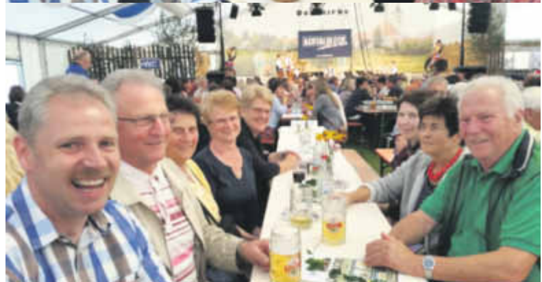
Die Ehrenmitglieder des Musikvereins beim Fröhlichen Feierabend