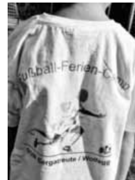
Camp T-Shirt gesponsert von der Leutkircher Bank

perabzeichen und das DFB-Fußballabzeichen auf dem Programm. Zur Mittagszeit wurde das komplette Trainingsgerät verräumt und anschließend im Sportheim wieder zu Mittag gegessen. Um kurz vor 13 Uhr ist das komplette Fußball-Ferien-Camp, mit dem Bus im Regen, zum Fußball-Golf nach Opfenbach / Allgäu aufgebrochen. Bereits hinter Wangen im Allgäu verschwanden allmählich die Wolken und wir hatten ein herrliches Wetter beim Fußball-Golf. Die Teilnehmer wurden in 11 kleineren Gruppen mit Betreuern auf den 18-Loch-Parcour geschickt. In weiser Voraussicht wurde allen Gruppen beim Empfang des Sportgerätes eine entsprechende Startbahn zugewiesen. Die einzelnen Gruppen hatten einen Riesenspaß und sahen danach auch entsprechend aus. Gegen 17 Uhr mussten alle wieder die Heimreise antreten. Am Samstag wurde dann wieder der ganze Tag auf dem Sportgelände in Wollegg verbracht. Zum Abschluss des Fußball-Ferien-Camps wurde allen Teilnehmern noch die Urkunde des Schnupper, bzw. Fußballabzeichens verliehen. Es waren drei herrliche Tage, die rundum super funktioniert haben. Hierzu nochmals ein herzliches Dankeschön für die ehrenamtliche Tätigkeit der Trainer und Betreuer, des Organisationsteams, der Fotografin und der Muttis in der Küche, sowie unseren Sponsoren: Leutkircher Bank, Mineralbrunnen Krumbach, Tupperware und JK Beschriftungen, Gebrazhofen, ohne