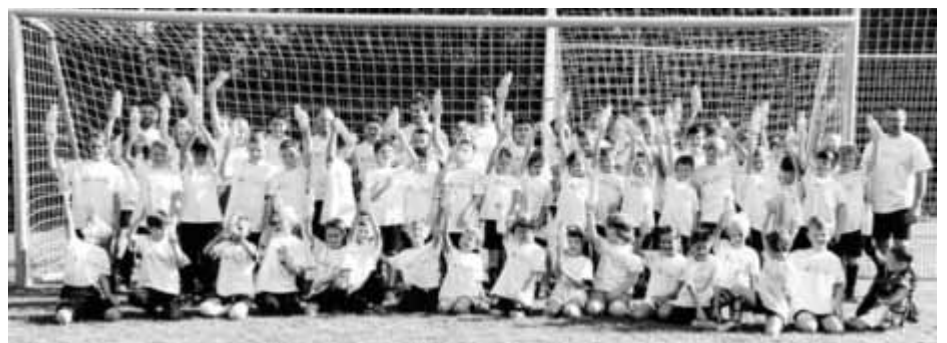
Alle Teilnehmer und Übungsleiter des Trainingscamps