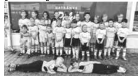
F-Junioren als Einlaufkinder beim FV Ravensburg

Am Samstag, 30.09.17 waren unsere F-Jugendlichen als Einlaufkinder beim Heimspiel des Oberligisten FV Ravensburg gegen Sandhausen II mit von der Partie. Neben den vielen Eindrücken im Fußballstadion und den persönlichen Kontakten zu den Profis, war dies für alle Beteiligten ein unvergessliches Erlebnis. Nicht zuletzt durch die gute und lautstarke Unterstützung der jungen Fans konnte der FV Ravensburg sein Heimspiel mit 3:1 gewinnen. Herzlichen Dank dem FV Ravensburg für die Einladung, den Spielern für die vielen Autogramme und allen Eltern für die Fahrbereitschaft und Betreuung während des gesamten Tages.