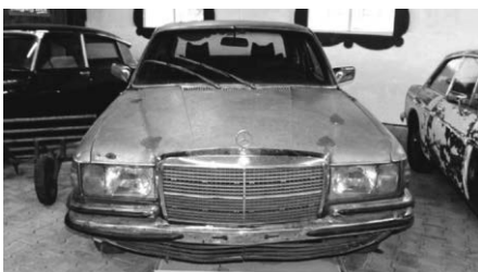
Einst ganzer Stolz seines Besitzers...