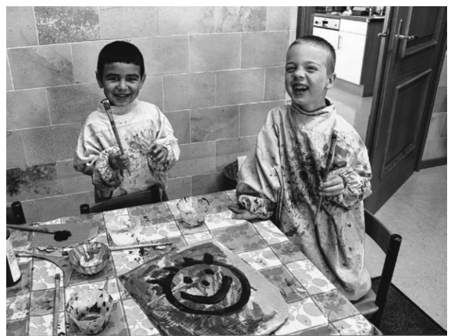
Viel Spaß beim Malen zum Thema „Ich bin Ich“