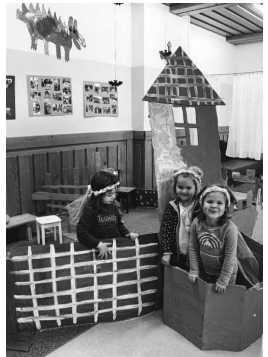
Die Burgfräuleins in der Ritterburg