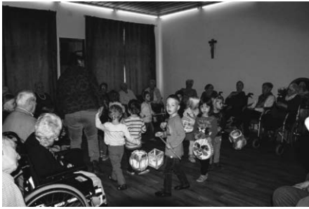
Zu Besuch im Haus Marientann