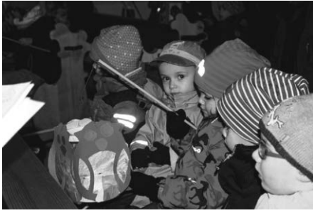
Festlicher Beginn in der Kirche