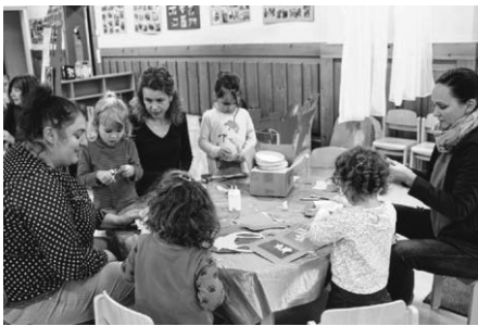
Gemeinsames Laternen basteln