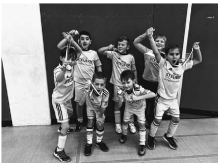
F1 beim Turnier in Weingarten

Die E-Junioren belegten am Samstag, 13.01.2018 in Runde 3 der Hallenbezirksmeisterschaft in Vogt einen hervorragenden 3. Platz und haben damit nur ganz knapp die Qualifikation für die Endrunde verpasst.