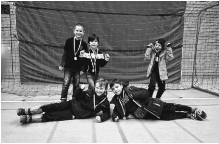
F2 beim Turnier in Weingarten