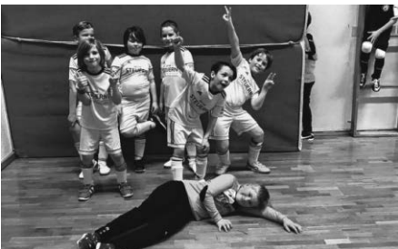
F1 mit dem 7. Platz

Am vergangenen Samstag hat die D-Jugend am Hallenturnier der TSG-LJG Unterschwarzach in Bad Wurzach teilgenommen. Nach einer starken Vorrunde erreichte unser Team einen hervorragenden 4. Platz. Jungs ihr ward spitze! Herzlichen Glückwunsch!