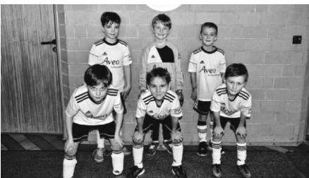
F2 mit dem 6. Platz