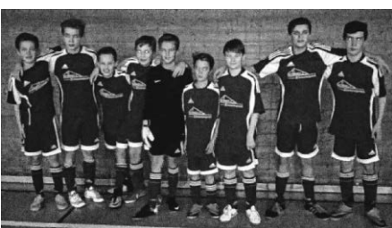
D-Junioren mit dem 4. Platz