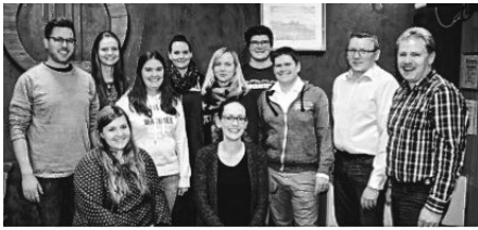
Der neue Jugendarbeitskreis