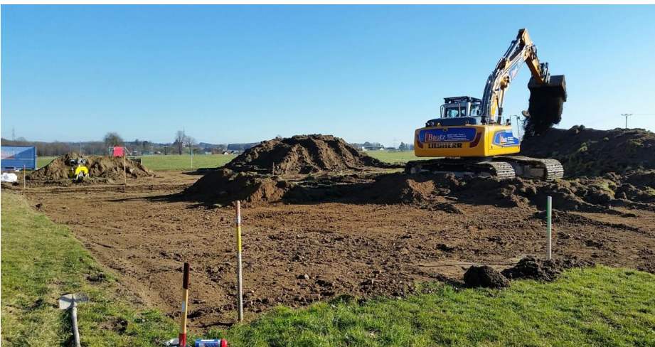
Der Oberboden im Bereich des zukünftigen Lebensmittelmarktes wird abgetragen

Nachdem Anfang Dezember 2017 mit dem offiziellen Spatenstich der Neubau eines Lebensmittelmarktes in Wolfegg gestartet werden sollte, hat das leider sehr unbeständige Wetter den tatsächlichen Baustart immer wieder verzögert. Am Montag dieser Woche konnten die Bauarbeiten nun endlich begonnen werden.