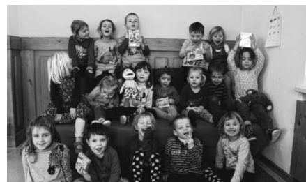
Euer Kindergarten St. Nikolaus

Unsere Sprachfördereinheiten heißen bei uns „Quassel-Stunden“, denn bei allen Einheiten wird uns „Quassel-Lise“ begleiten. In den ersten gemeinsamen Stunden werden wir die Sprachfreude wecken, Gesprächsregeln besprechen und den Wortschatz erweitern.