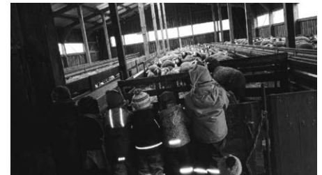
Ihr Kindergarten St. Maria

Auch im neuen Jahr freuen wir uns auf die Begegnungen in unserem Dorf und wer weiß - vielleicht klopfen wir auch bei Ihnen an.