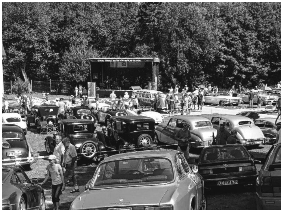
Oldtimer Picknick im Hofgarten