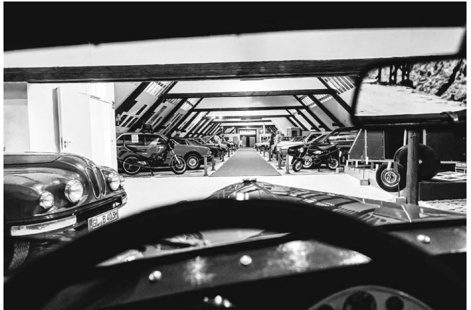
Automuseum Wolfegg 2018

In der neuen Saison bieten wir an Sonn- und Feiertagen öffentliche Führungen an. Wir informieren über die jeweiligen Uhrzeiten auf unserer Homepage.