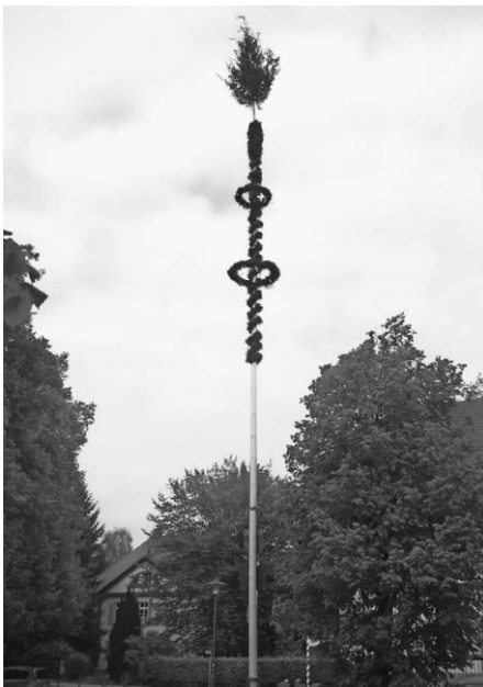
Maibaum in Wolfegg

In diesem Sinne noch einmal vielen herzlichen Dank an alle Beteiligten für ihr Engagement und ihre Bemühungen.