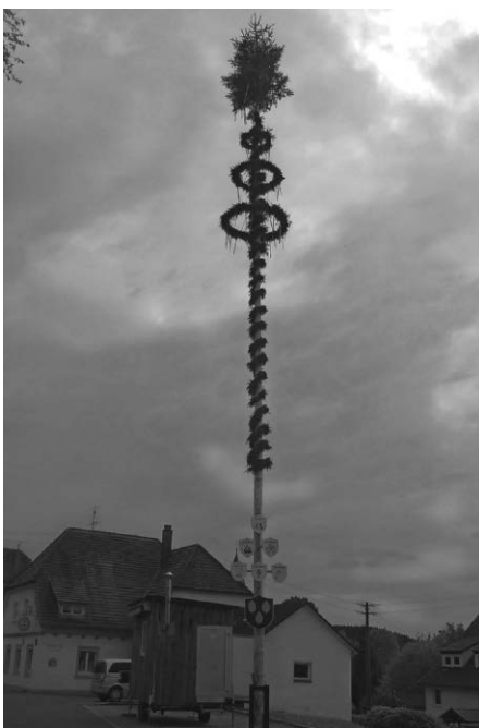
Maibaum in Alttann