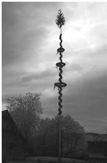
Maibaum im Bauernhaus-Museum