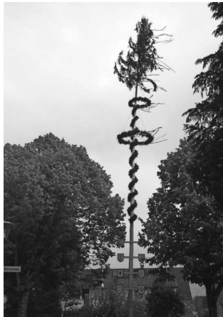
Maibaum in Molpertshaus