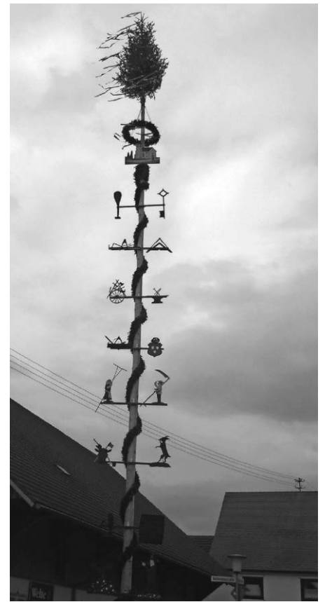
Maibaum in Rötenbach