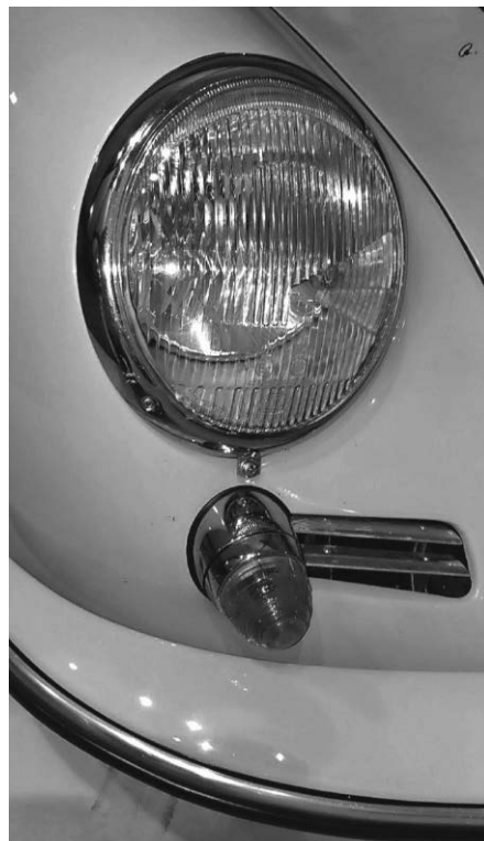
Porsche 356 Carrera