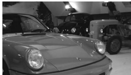
Vom Volkswagen über den Volksschlepper bis zur Sportwagen-Legende

der Zeit variieren. so wird auch die Porsche Ausstellung einige Überraschungsgäste zeigen. Wir werden davon berichten.