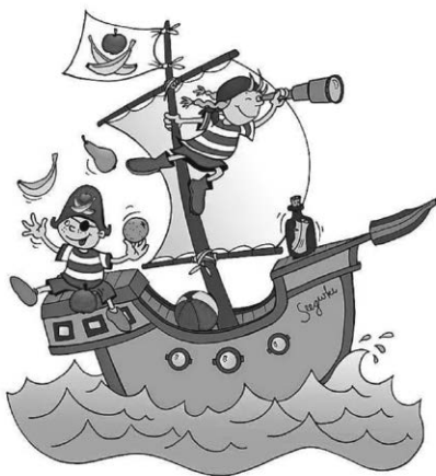
Finn und Fine die Projekt-Piraten zur gesunden Ernährung