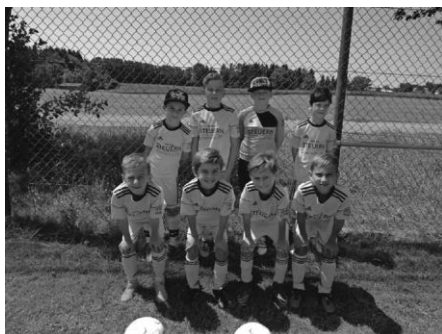
F-Junioren, 5. Platz in Waltershofen

Am vergangenen Sonntag hat die F-Jugend beim Oskar-Farny-Turnier in Waltershofen einen hervorragenden 5. Platz erreicht. Bei sehr sommerlichen Temperaturen haben die Spieler in ihrer Vorrundengruppe (2 Siege, 1 Unentschieden, 1 knappe Nie- derlage) alles gegeben und haben sehr unglücklich das Halbfinale verpasst. Im Platzierungsspiel um Platz 5 gab es ein klares 3:0 gegen den TSV Neukirch.