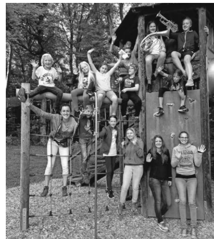
Auch nach dem Klettern noch voller Energie!

Am Samstag, den 13.10.2018, ging es mit unseren Wolfegger Jungmusikanten zum gemeinsamen Ausflug. 13 Kinder und Jugendliche wurden vom Musikverein Wolfegg in den Kletterwald nach Immenstaad eingeladen. Vom reichhaltigen Picknick gestärkt waren die Kinder nicht zu stoppen und eroberten gemeinsam mit den Betreuern begeistert die Baumwipfel. Die Großen halfen den Kleinen, sodass jeder die anstehenden Hindernisse meistern konnte. Nicht nur beim Klettern, sondern auch auf dem anliegenden Spielplatz hatten wir alle zusammen einen riesen Spaß. Es war ein erlebnisreicher Tag in einer tollen Gemeinschaft. Wir freuen uns schon auf den nächsten Ausflug! Euer Musikverein Wolfegg e.V.