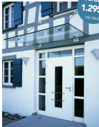
SPRINZ Punktgehaltenes Vordach 2.100 x 1.250 mm ohne Montage