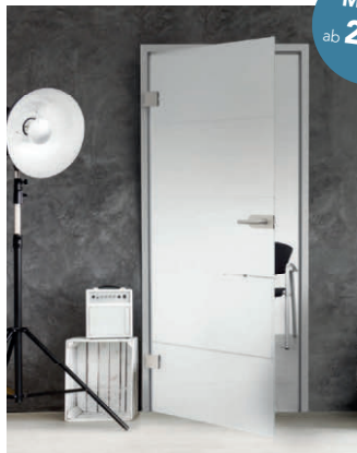
SPRINZ Ganzglasinnentür 1-farbiger Siebdruck inkl. Beschlag