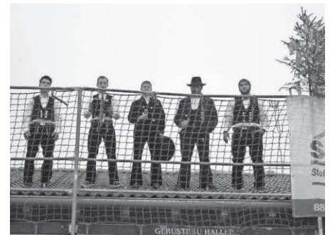
Die Zimmerleute der Zimmerlei Schnell beim Richtspruch

Wir wünschen der Firma Leuthe als Generalunternehmer weiterhin viel Erfolg und eine unfallfreie Baustelle. Gemeinde Wolfegg