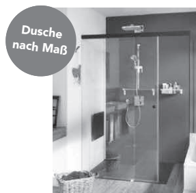
SPRINZ Glasdusche Maßanfertigung nach persönlichen Vorstellungen durch fachkundige Beratung