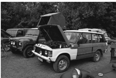
oder Rustikal ob herrschaftlich...