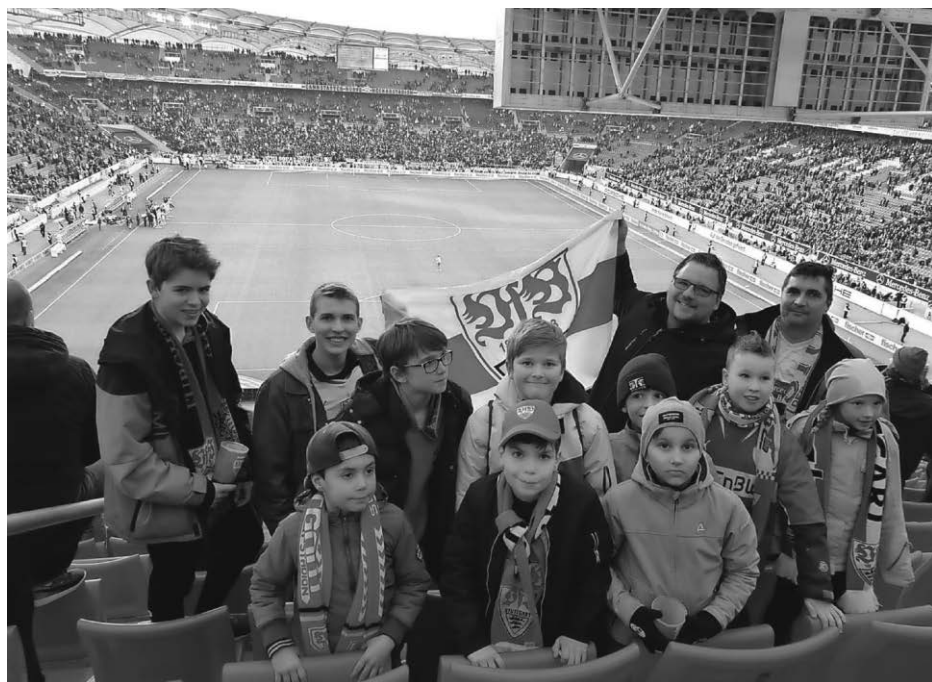
Jugendspieler und Betreuer im Stadion des VfB Stuttgart