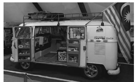
T1 Combi aus Malaysia