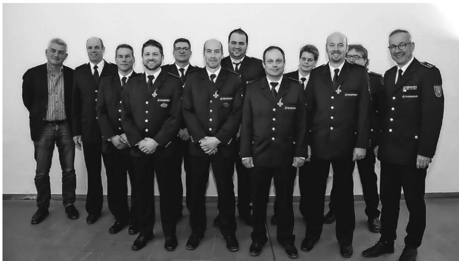
Bei der Jahreshauptversammlung 2019 der Feuerwehr Wolffegg erhielten zahlreiche Kameraden eine Beförderung oder wurden für ihre Dienstzeit geehrt. Bild/Text: Florian Bodenmüller

Liebe Reiter, wir wünschen euch weiterhin viel Erfolg!