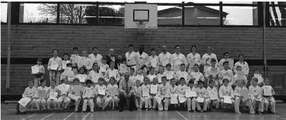
Gürtelprüfung in der Gemeindehalle Wolffegg