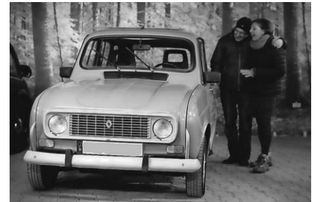
2 CV, R4 oder einer der Löwen aus dem Hause Peugeot...