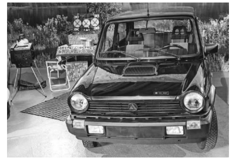
Autobianchi, Lancia, Fiat, Moto Guzzi etc.