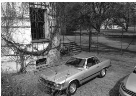
Es wird zwar wärmer, aber so schneefrei wie 2017 wird es nicht...