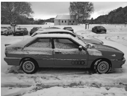
Mancher wurde gar für Schnee geschaffen...

Gute Laune und warme Kleidung dürfen gratis mitgebracht werden.