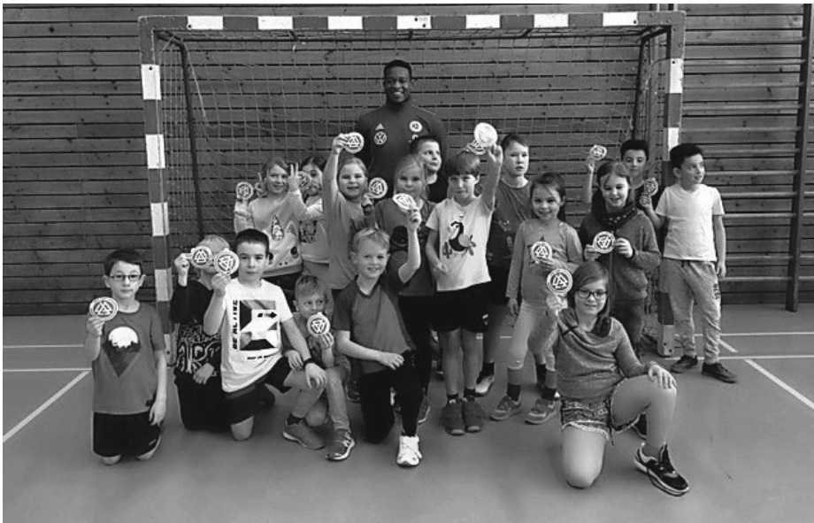
Text: DFB/Schule, Bild: Schule