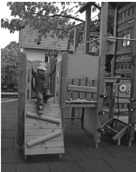
Das neue Klettergerüst