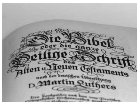
Grafik: © Wodicka/epd

„Wo 3000 Jahre wie im Flug vergehen“, „Wo die alten Worte gar nicht alt aussehen“, „Wo Familien gerne reinkommen“ - so wirbt die Bibelgalerie Meersburg auf Ihrer Webseite. Das kleine Museum mit vielen Mitmachelementen bietet wieder Führungen an.