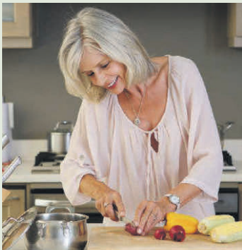
Eine ausgewogene Ernährung mit viel Gemüse, Obst und wichtigen Nährstoffen ist die Basis einer gesunden Lebensweise.

Wer Vorerkrankungen im Griff hat und gesund lebt, kann Infekte besser abwehren