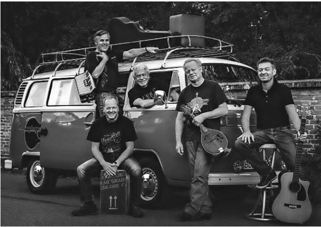
Die Rock- und Pop-Band „Unplugged Prochecked“ bringt die Kulisse musikalisch wieder in die richtige Zeit und Stimmung

Wer sich lieber bekochen bzw. begrillen lassen möchte, hat wie gewohnt auch die Möglichkeit das Catering des Fördervereins des Wolfegger Musikvereins zu nutzen. Neben klassischem und exotischem Grillgut bietet der Verein Salatteller, Käse-Spätzle sowie Kaffee und Kuchen an. Dieses Jahr gibt es zum Auftakt jedoch auch wieder ein zünftiges Weißwurst-Frühstück. Es lohnt sich also früh vor Ort zu sein.