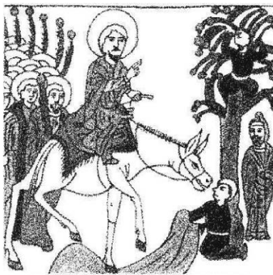
Amenische Kunstskachei