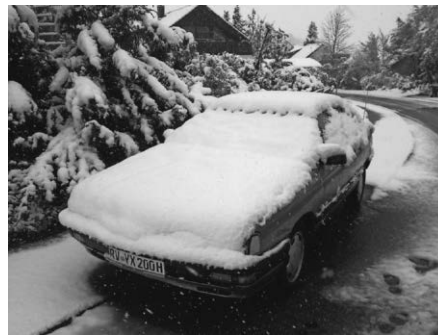
Leider bleibt uns ansehnliches Winterwetter am Wochenende verwehrt.

Für das leibliche Wohl ist gesorgt. Neben der üblichen Currywurst mit Kartoffelecken, in Anlehnung an die „Cars and Currywurst“ Treffen, besteht die Möglichkeit Kuchen und Heißgetränke zu bekommen.