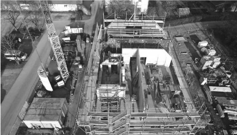
Das Luftbild zeigt den Baufortschritt der Arbeiten am Dachgeschoss zu Beginn der KW 10/2021.

Auf der Baustelle geht es gut voran und das Haus nimmt Konturen an. In dieser Woche sollen die Giebelwände gemauert und die Zwischenwände betoniert werden. Außerdem soll die Decke für den Technikraum im Dachgeschoss betoniert werden. Es bleibt zu hoffen, dass der neuerliche Kälteeinbruch den Bauablauf nicht wieder stören wird.