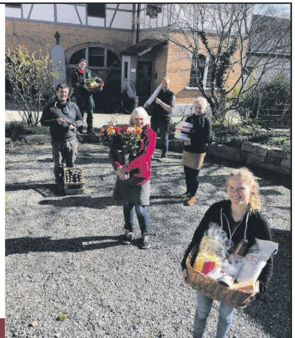
Im Liebenauer Landleben gibt es alles für den täglichen Bedarf.

Siggenweiler Str. 10 | 88074 Meckenbeuren Tel. 07542 10-1297 | www.stiftung-liebenau.de