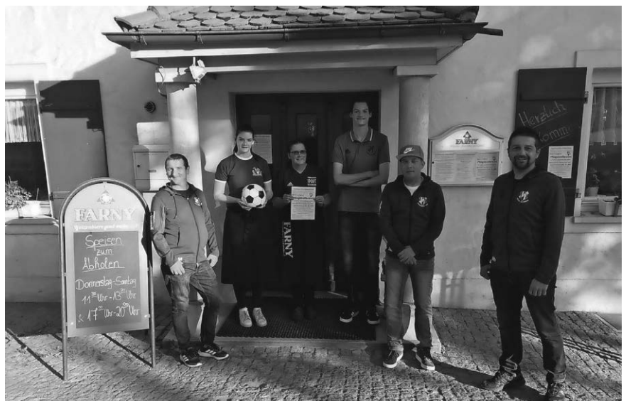
Familie Weiler (Gasthaus Adler) mit Vorstandschaft des FV Molpertshaus