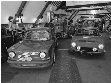
Simca Sonderausstellung 2020 - noch immer im Haus

Die vereitelte Wintersonderausstellung Renntourenwagen lohnt den Weg ins Automuseum, sollte vor Ostern die Öffnung möglich werden.