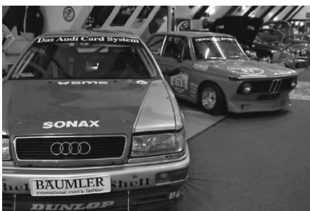
Sonderausstellung Renntourenwagen 2020/2021 mit DTM Audi V8 quattro und BMW 2002 Berg-Rennwagen