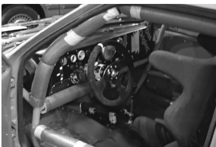
Sonderausstellung Renntourenwagen Winter 2020/2021. Leider bisher im Verborgenen.