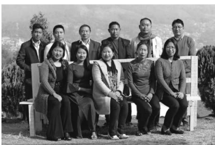
Lehrkräfte der Universität

Heute ist das WTC eine anerkannte Hochschule. Die Studierenden und der Lehrkörper stammen aus unterschiedlichen ethnischen und konfessionellen Zusammenhängen und erleben hier ein enges multikulturelles Miteinander.