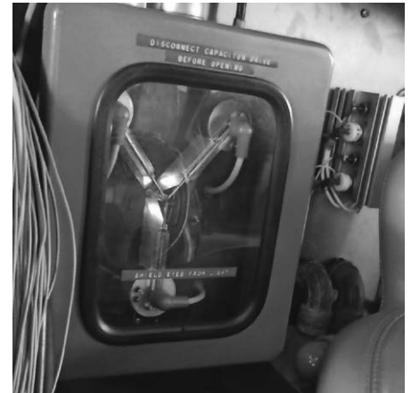
Eine kleine Zeitreise ist im Automuseum Wolfegg eigentlich immer möglich. Nun jedoch auch stilecht mit einem Flux-Kompensator in einem DeLorean zur Zeitmaschine verbaut.