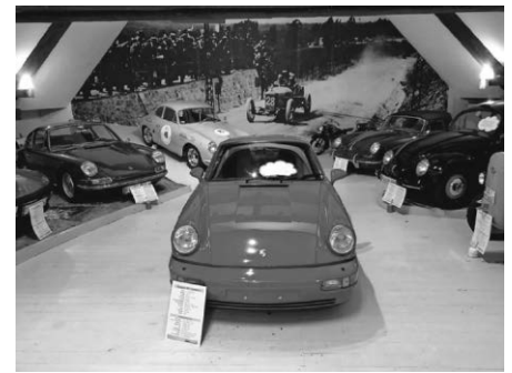
Das Porsche Rondell im Museum seit 2018 fester Bestandteil der Ausstellung

Opel Kapitän aus dem Jahr 1957 nebst Mopeds und Kleidern aus etwa dieser Zeit. Der Kapitän hat inzwischen einem Admiral aus dem Jahr 1969 Platz gemacht.