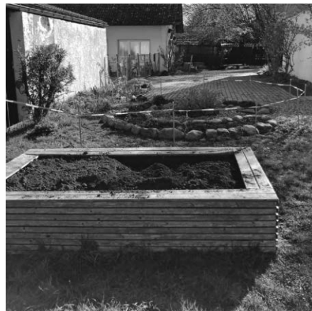
Unsere Beete werden neu gemacht

Hochbeet repariert und mit neuer Erde befüllt. Unsere Kräuterspirale wurde ausgeputzt und mit neuen Kräutern bestückt. Kleine Blumentöpfe wurden befüllt und Samen darin zum Vorkeimen vergraben. Natürlich wurden auch fleißig Blumensträuße gebunden und die Bienen bei ihren ersten Flugstunden beobachtet. Die ersten Sonnenstrahlen wurden genossen und den Vögeln beim Singen zugehört. Das Erwachen der Erde ist jedes Jahr aufs Neue etwas, das Groß und Klein begeistert. Wir freuen uns darüber, dass unser Garten mit jedem Tag ein wenig weiterwächst, und können es kaum erwarten schon bald unsere vorgezogenen Pflanzen in das Hochbeet zu setzen.