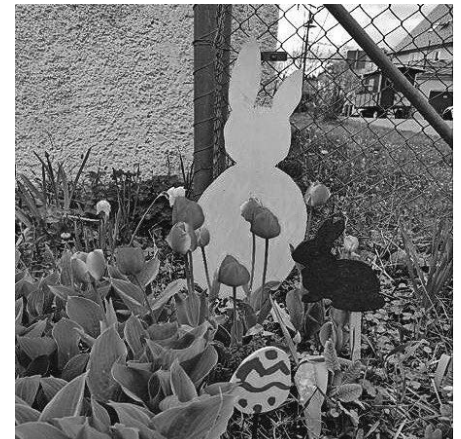
Blütenpracht im Kindergarten