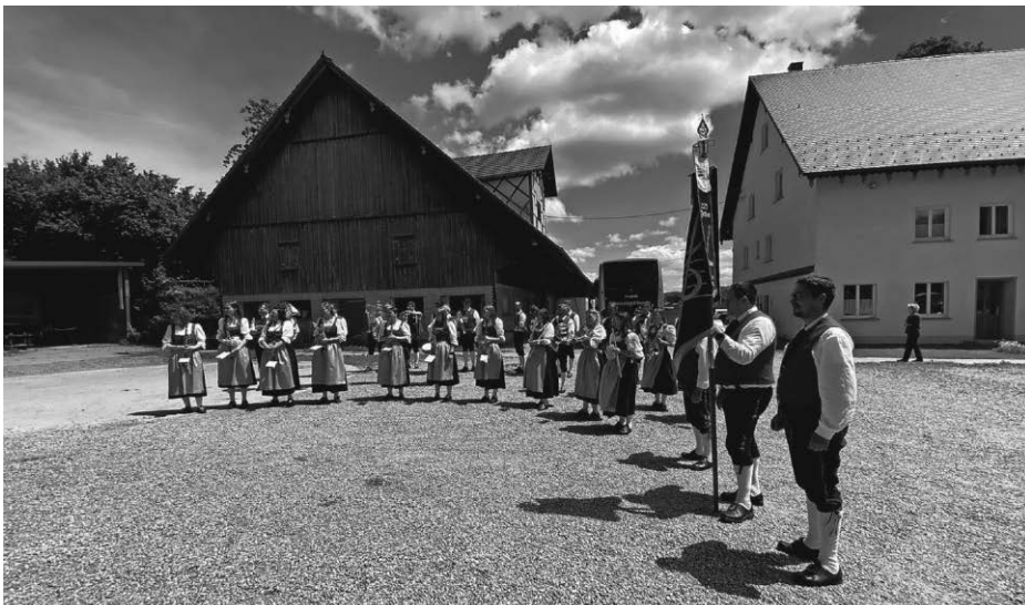
Die Musikkapelle im Reiter-Quartier Zundelbach