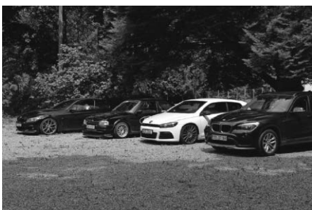
Jung und Alt treffen sich beim Juniors Day - Junge Leute auf alten und/oder besonderen Autos.