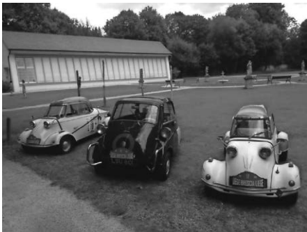
Rally Liège - Brescia - Liège 2018 mit ihren Kleinwagen im Hofgarten

Am Sonntag bleibt es in Wolffegg spannend. Nach den Jahren der Absagen aller Events werden wir am Sonntag ab 11 Uhr unseren 2. Wolffegger „Juniors Day“ veranstalten. Geladen sind hierzu Youngtimer, Oldtimer und Exoten. Die deutlichste Baujahresbeschränkungen gelten bei diesem Treffen jedoch den Fahrern; - diese dürfen nämlich nicht älter als 30 Jahre alt sein. Wer also ein solches Fahrzeug besitzt ist am Sonntag von 11 Uhr bis 16 Uhr herzlich in den Hofgarten neben dem Automuseum eingeladen. Das Mitbringen von einem eigenen Picknick ist erlaubt. Für das leibliche Wohl ist neben Getränken mit „Bernie`s Bester“ Thüringer Rostbratwurst bestens gesorgt.