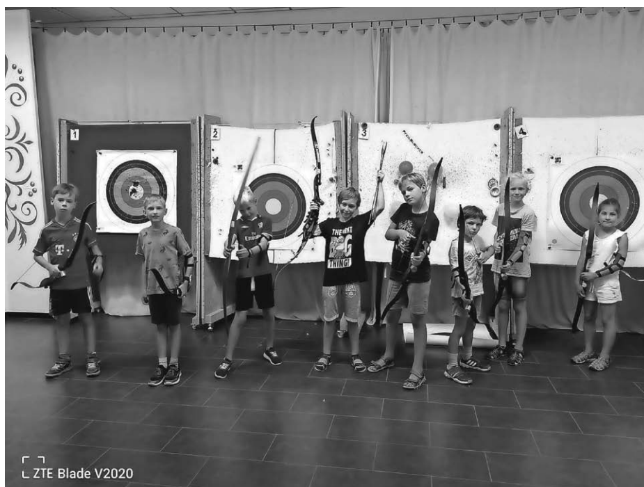
ZTE Blade V2020

„Oberschwaben ist reich an hochwertigen Kiesen. Sie sind ein wahrer Goldschatz für Kiesunternehmer, benötigt genauso für Hausbau als auch fragwürdigen Export, Um dieses schwäbische Gold zu heben, werden immer wieder neue Kraterlandschaften in eine der schönsten Landschaften Mitteleuropas gerissen. Doch bisher hat die Kieslobby es immer wieder geschafft, ihre Vorhaben durchzusetzen. Auch dank des Wohlwollens der zuständigen Behörden und Ämter. Ein Kriminal-Roman, der in Oberschwaben und in der Bodenseeregion spielt.“