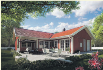
Das klassische Schwedenrot der Holzfassade ist ein bekanntes Symbol für den skandinavischen Baustil.

(djd). Mit der typisch-skandinavischen Behaglichkeit stehen Schwedenhäuser auch hierzulande hoch im Kurs. Unter der traditionellen Optik mit farbenfrohen Holzfassaden, Veranden und Sprossenfenstern verbergen sich heute eine zeitgemäße Spartechnik und sehr gute Energieeffizienz. Mit über 75-jähriger Erfahrung hat etwa Eksjöhus das Konzept der Schwedenhäuser