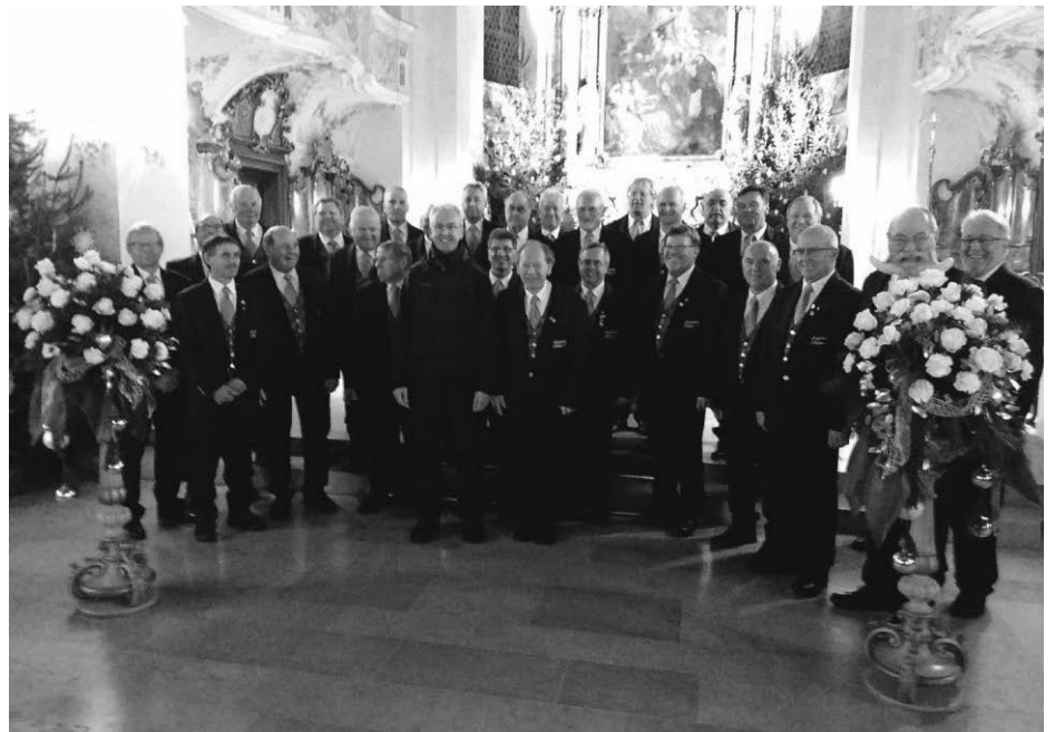
Ein Bild aus besseren Tagen - Weihnachtskonzert 2017

Wir hoffen sehr, dass wir am Schnurranten 2022 wieder gemeinsam auf das neue Jahr