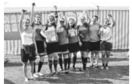
Sieger Damen „Brokolea and Friends“

Da das Teilnehmerfeld mit nur 4 Teams bei der Jugend doch sehr klein war, entschied man sich nach Rücksprache mit den Mannschaften, eine „Doppelrunde“ auszuspielen. Die beiden Erstplatzierten aus dieser Doppelrunde spielten dann im Finale und der Dritt- und Viertplatzierte spielten um Platz 3. Sieger wurde am Ende die Mannschaft „Mein persönlicher Favorit“, die sich im Finale gegen die „Soccer Unicorns“ durchsetzten. Den 3. Platz belegten die „Dorfkicker“ vor der Mannschaft „5 gewinnt“. Bei der abschließenden Siegerehrung floss