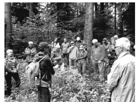
Fischzucht, Kiesabbau, Windkraft (geplant), Klimawandel. Der Altdorfer Wald war und ist dem Wandel unterworfen.

Weitere Informationen zu unserem diesjährigen Altdorfer Wald Exkursionsprogramms finden Sie im BUND Terminkalender unter https://www.bund-ravensburg.de