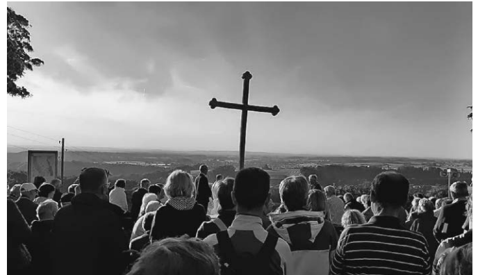
Sühmesse am 13.06.2024

Ausblick: Heilig Blut-Fest Bad Wurzach, am Freitag den 12.07.2024 Blutfreitagsgemeinschaft Wolfegg