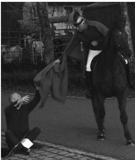
St. Martin teilt seinen Mantel.

Der Abend des St. Martinsfestes begann mit dem traditionellen Martinsspiel, welches die Geschichte des heiligen Martin lebendig werden ließ. Anschließend setzte sich der Laternenumzug in Bewegung. Eltern, Großeltern, Geschwister sowie Kindergartenkinder zogen mit ihren bunt leuchtenden Laternen durch Alttanns Straßen. Begleitet vom Musikverein wurden unterwegs verschiedene Laternenlieder gesungen, die für eine besonders stimmungsvolle Atmosphäre sorgten.