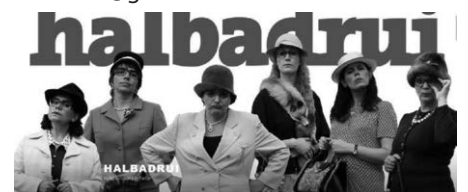
Pressebild der Frauengruppe „Halbadrui“

Bewertung: Getränke/Imbiss. Eintritt 15 EUR Karten an der Abendkasse. Vorverkauf über: karlsmotz@gmx.de NU