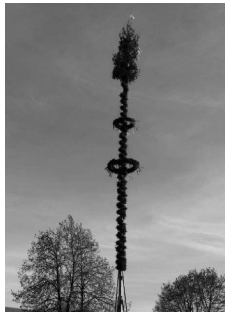
Vielen Dank und gut Pfad! Die Pfadfinder Wolfegg

Hierzu laden wir euch herzlich ein und freuen uns auf euer Kommen.