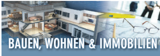
Ungerade KW*: in Pattonville