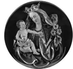
Maiandachten in der Seelsorgeeinheit „Oberes Achtal“ 2026

Christi Himmelfahrt, 14.05. bis 22.05.2026 täglich 20.00 Uhr; Dauer 30 - 40 Minuten, Kirche St. Katharina, Wolffegg