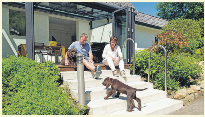
Mehr Wohnraum und mehr Lebensqualität: Der gläserne Anbau hat das Haus aus den 1950er-Jahren deutlich aufgewertet.