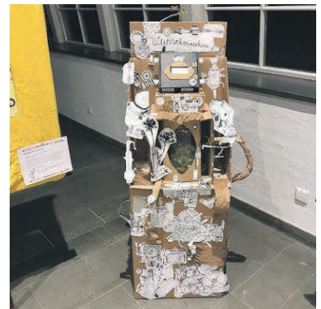
Text und Bilder: K. Zefert